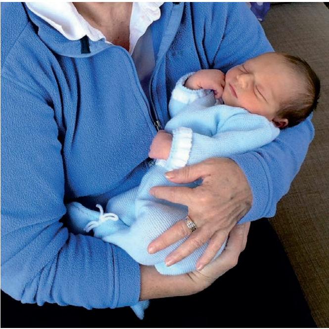
Sicherheit im Rücken, Umhüllung vom anderen