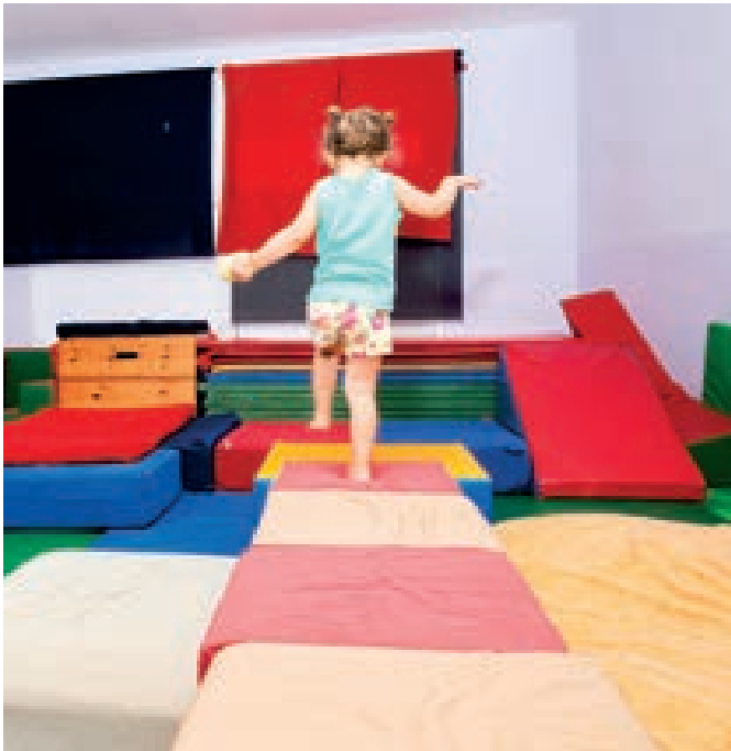
Stützpunkte, Körperachse, Arme – Vertikalität im Gleichgewicht

Einer der von Eltern – und vor allem von Erzieher:innen – am häufigsten genannten Reifungsindikatoren ist der Gebrauch der Hände des Kindes. Ihre Fähigkeit, ihre Kraft, ihre Auge-Hand-Koordination oder die so oft erwähnte „Feinmotorik“ bezieht sich in 90 Prozent der Fälle auf den Gebrauch der Hände. Kulturell werden menschliche Hände mit der Idee von Arbeit, Produktivität und Effizienz bei der Gestaltung der Umwelt assoziiert, die die Menschheit vorangebracht hat. Und dieser Gedanke ist bis zu einem gewissen Grad auch heute noch vorhanden, wenn wir beurteilen, wie Kinder ihre Hände benutzen. Wir sehen die Hände als Werkzeug, nicht als Teil des kindlichen Körpers, nicht als Teil des sich entwickelnden Menschen, dessen Hände an den gleichen Reifungsprozessen und Problemen beteiligt sind wie der Rest der Person.