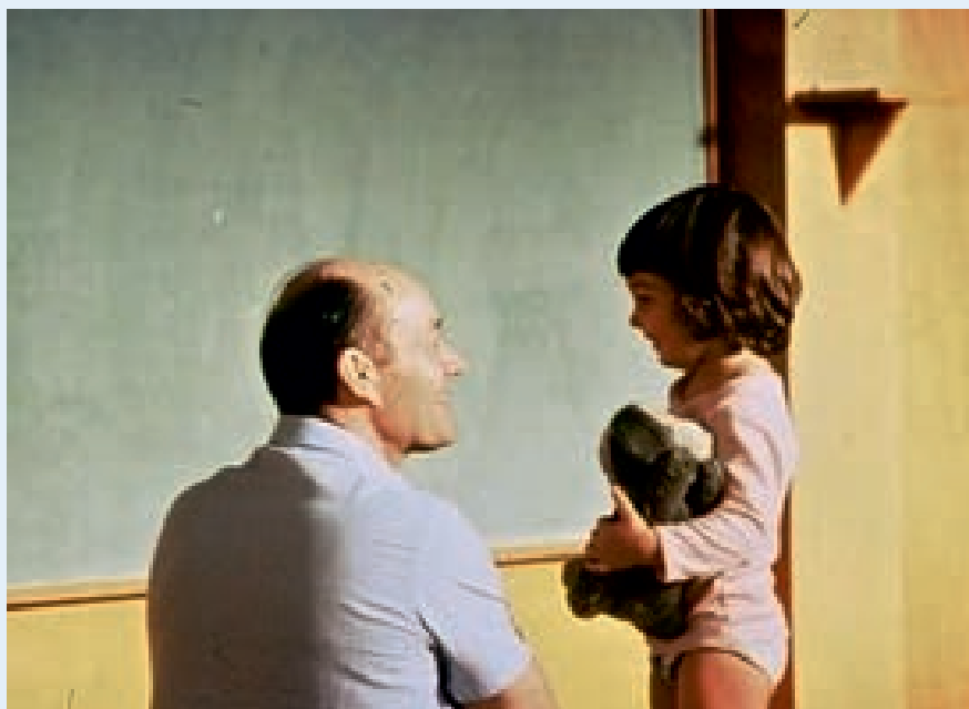
Im psychomotorischen Raum leben wir eine wohlwollende Haltung gegenüber dem Kind (Aucouturier).

Wir stehen daher nachdrücklich hinter unserer Haltung in der psychomotorischen Praxis und wir befürworten sie in allen anderen Erziehungsbereichen. Eine solche Haltung ist die beste Lösung für die psychische Entwicklung des Kindes und seine Fähigkeit zum Lernen.